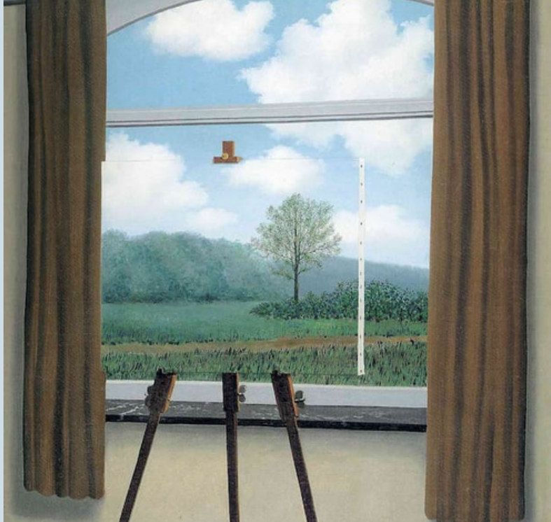
Images by René Magritte

SEMINARIO PER PROFESSIONISTI/E DELLA CURA